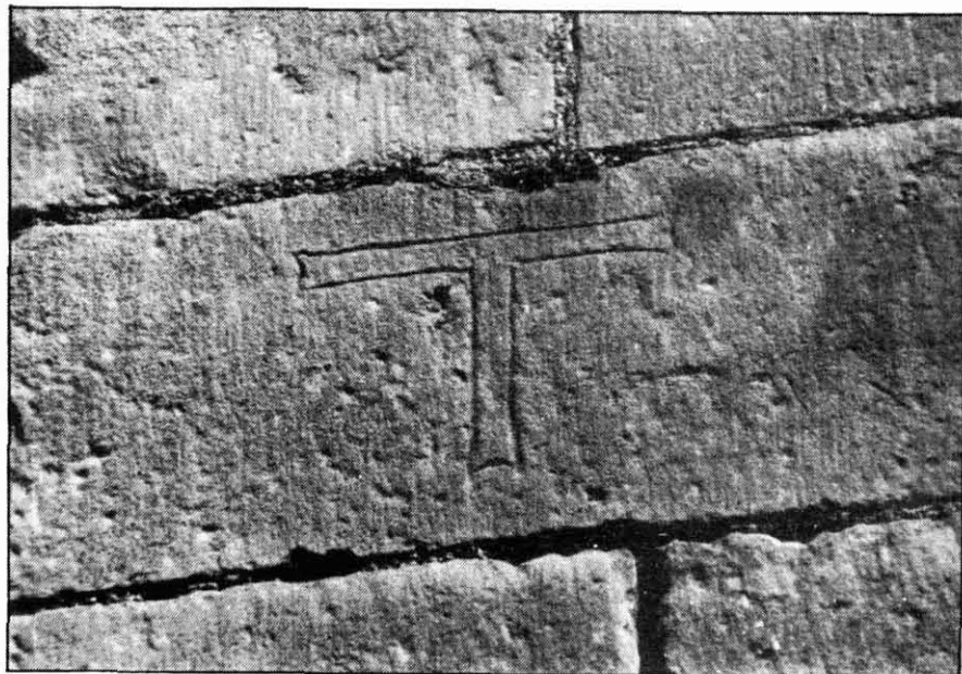
Una de les variants en què trobem la marca amb forma de T.

El següent punt en qüestió seria la distribució d'aquests signes a les diferents zones de la basílica. El primer que crida l'atenció és el fet que aquesta distribució no és uniforme. Les marques es concentren, sobretot, a l'absis, i van minvant a mesura que ens apropem a la façana principal, és a dir, a mesura que la construcció és més tardana. S'observa clarament que a partir del s. XV les marques de picapedrer van deixant d'emprar-se paulatinament.