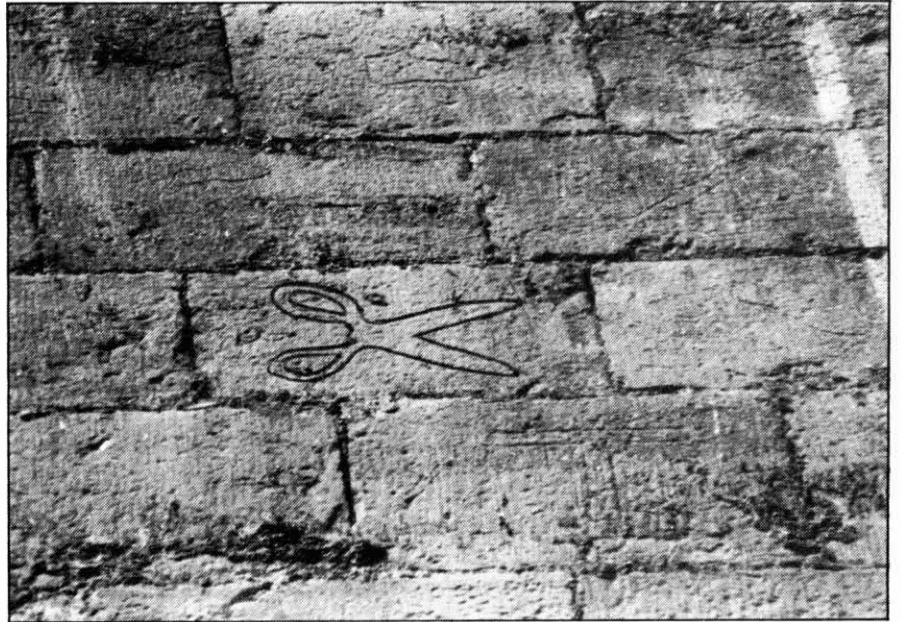
Al carru del centre, marca on hi són representades unes tisores.

Aquesta hipòtesi ve recolzada per l'existència del retaule de St. Marc i St. Anià, realitzat a mitjans s. XIV per Arnau Bassa i que actualment és situat a la capella de St. Marc, tot i que originàriament era per a la capella dedicada al gremi de sabaters de Barcelona als seus patrons a la catedral de dita ciutat (7). La importància que per a nosaltres té aquest retaule rau que en representar la curació del sabater Anià reflecteix l'obrador d'un sabater on es veuen les típiques sabates dels segles XIV i XV tal i com apareixen a les marques, així com les agulles i tisores. En una altra taula, que representa la consagració episcopal de St. Anià, aquest es troba vestit amb una casulla on hi ha brodat aquest mateix tipus de sabates, que tornen a aparèixer com a símbol distintiu als escuts del gremi de sabaters de Barcelona, situats a la part superior del retaule.